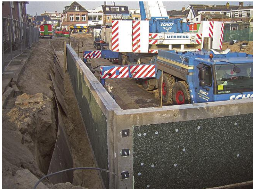
Einbau der Rückhaltebecken in der Stadt

Es ist möglich nachhaltige Wasserkonzepte einzuführen, aber mit dem jetzigen Denkmuster 1. sofort einen optimalen Plan bereit zu haben und 2. der Finanzierung der Projekte durch die öffentliche Hand, sind diese zu teuer. Eine signifikante soziale Neuerung wird benötigt, um mit der Komplexität und den damit verbundenen Unsicherheiten umzugehen. Die KWW-Strategie bietet dazu gute Möglichkeiten.