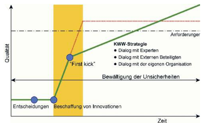
Grafik 2: Einige Merkmale der KWW-Strategie