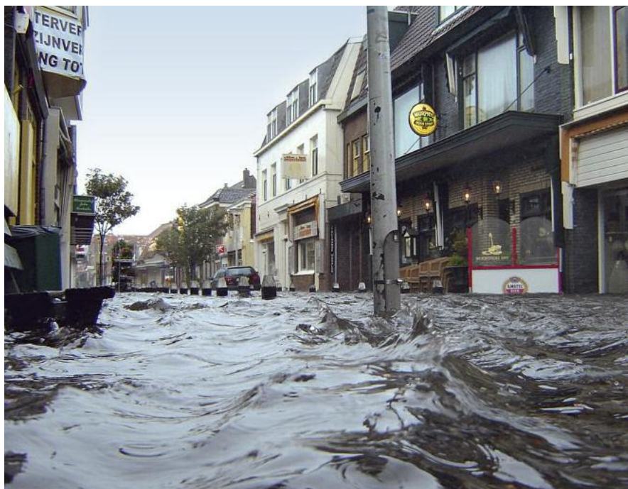
Überflutete Innenstadt Egmond aan Zee

Im Prinzip war die angewandte Technik schon bekannt und nicht wirklich eine Neuerung. Jedoch die Auswahl der richtigen Komponenten und der Einbau dieser in ein dicht bebauten Stadtgebiet erforderten einen erhöhten Aufwand. Es hat sich jedoch >>